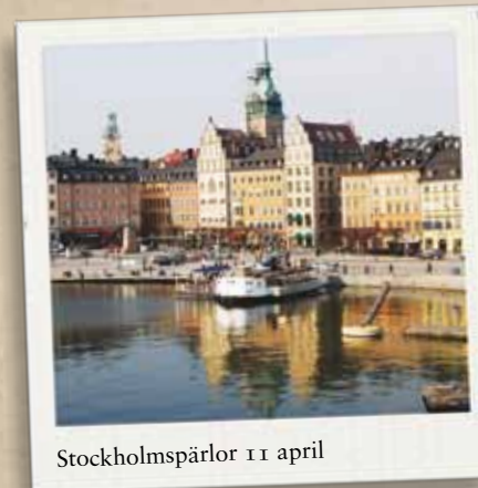
Stockholmspärlor 11 april