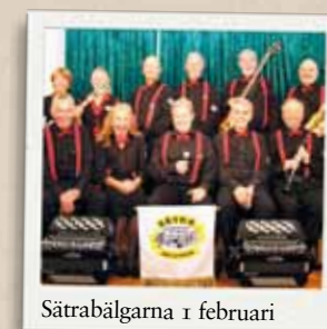
Såtrabälgarna 1 februari