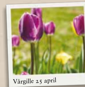
Vårgille 25 april