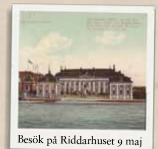
Besök på Riddarhuset 9 maj